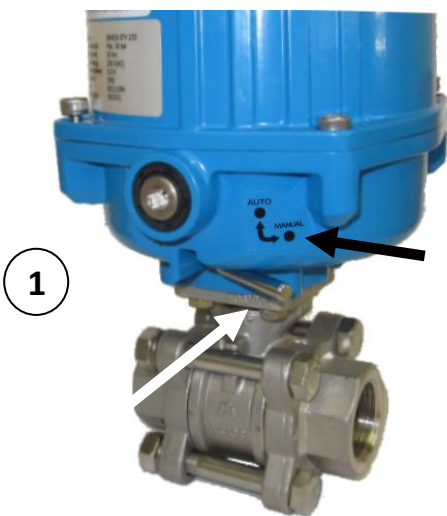
Levier de sélection en position MANUEL

La commande de secours manuelle n'est pas conçue pour être une commande manuelle permanente!